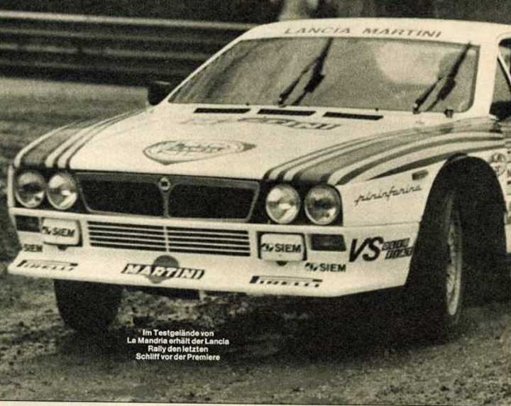
Im Testgelände von La Mandria erhält der Lancia Rally den letzten Schliff vor der Premiere

Das neue Rallye-Auto des Fiat-Konzerns soll an die Erfolge des legendären Stratos und des Fiat 131 anknüpfen