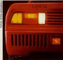
Heck: Motorhaube mit Rückleuchten

Wer da auch immer behauptet, die Zeit der aufregenden Automobile sei vorbei – weil der Windkanal alle gleichmache und der Drang zur Abgasentgiftung der freien Leistungsentfaltung immer weniger Chancen gäbe – muß sich dann und wann eines Besseren belehren lassen. Gehen Sie zu Ihrem nächsten Lancia-Händler, legen Sie ihm einen Scheck über knapp 80 000 Mark auf den Tresen und verlangen Sie dafür einen Lancia Rally. Aber beeilen Sie sich, denn nur 22 Stück haben ihren Weg über die Alpen gefunden. Den Rest der einmaligen 200er Serie haben die Italiener gleich bei sich behalten. In ihren Landen steht man Fahrzeugen dieser Machart auch ganz anders gegenüber: Man hätschelt sie, wenn sie sich beim Warmlaufen verhalten, man ignoriert den nicht vorhandenen Kofferraum und wertet das Kreischen des Kompressors nicht als Lärmquelle, sondern als interessanten Beitrag zur Verkehrsrausodie. Einer Betrachtungsweise, der sich übrigens auch die hiesige Polizei und die Verkehrszulassungsbehörden anschließen. Ein erster Blick auf den Rally, ein erster Gang um die 1245 Millimeter ho-