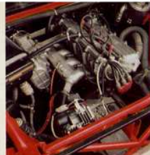
Motor: Vierzylinder mit Kompressor