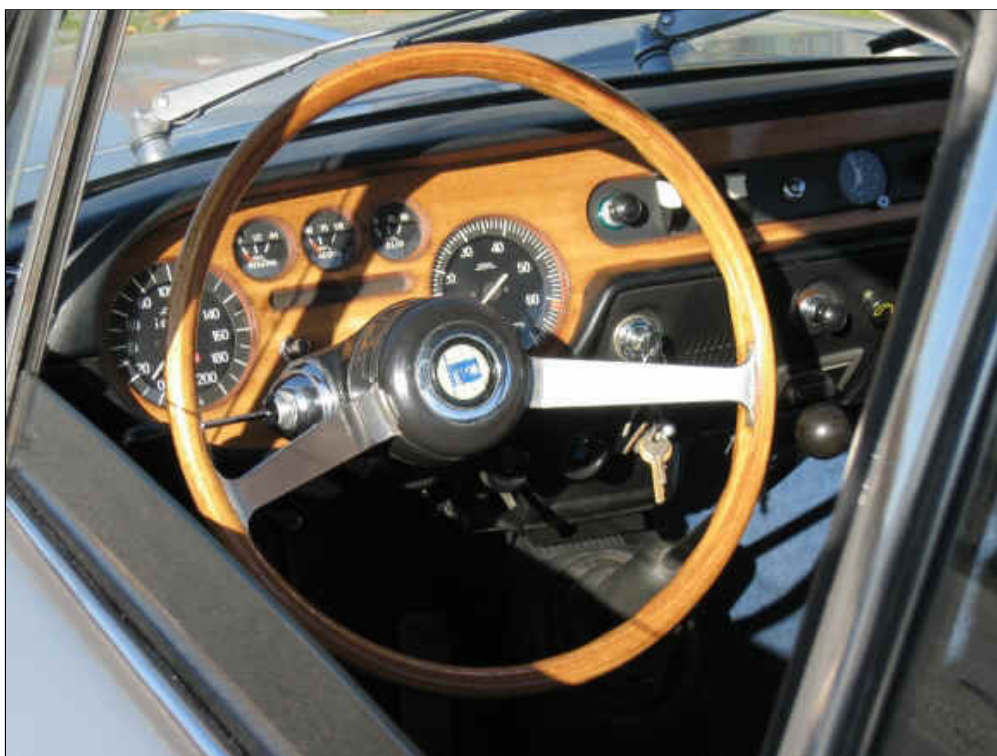
Klassische Rund-Instrumentierung: Tachometer, Drehzahlmesser, Anzeigen für Benzinvorrat, Kühlwassertemperatur und Öldruck. Das stilvolle Holzlenkrad gab es in der ersten Serie ab Werk.