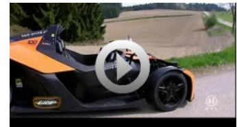
Grip - das Motormagazin - Beschleunigungsrennen MTM KTM X-Bow RTL 2 - DE